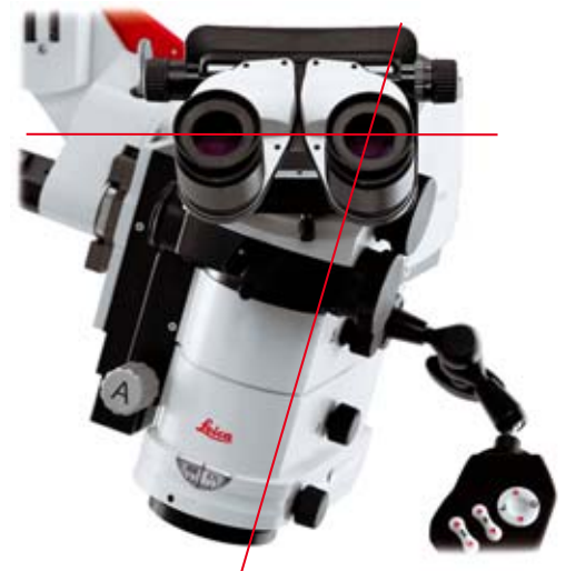
Leica M520 con Leica DI C500 o Leica Ultra Observer, posición horizontal ergonómica del tubo a pesar de la posición inclinada del cabezal óptico