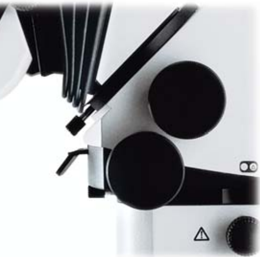
Detalle importante de Leica ULT 500: Palanca de conmutación para la salida del ayudante: lateral o trasera